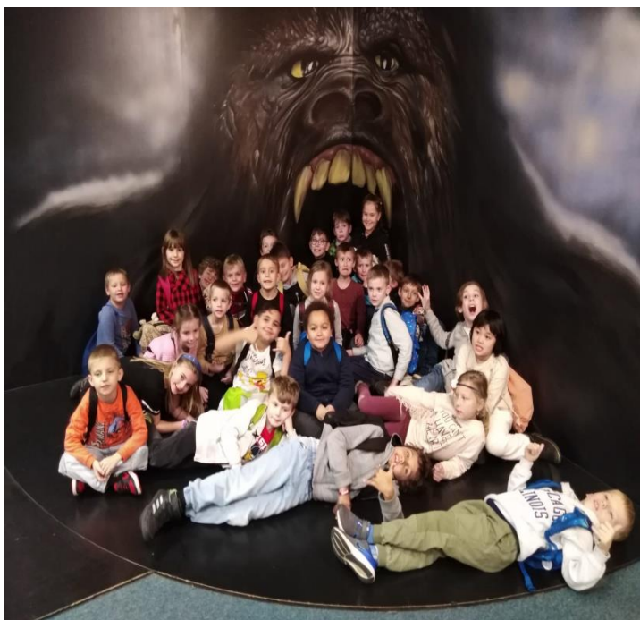
Muzeum fantastických iluzí