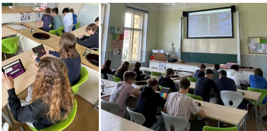
Využití tabletů v hodině angličtiny (žáci 9. třídy), procvičování formou interaktivního kvízu

V dalších třech třídách byl místo počítače a monitoru instalován notebook. Cílem této změny byla větší flexibilita a časová úspora vzhledem k rychlejšímu fungování zařízení.